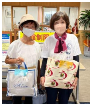
前浜ゆうゆう会様

・前浜ゆうゆう会（雑巾） ・宮崎地区遊技業組合様（クッキー・野菜ジュース） ・富士製菓（上生菓子の寄贈） ・宮崎神宮様（新嘗祭） ・フェニックスリゾート（ポインセチア） ・宮崎市社会福祉協議会（新聞紙細工）を頂きました。 有難うございました。