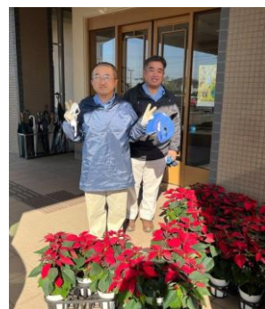
フェニックスリゾート様