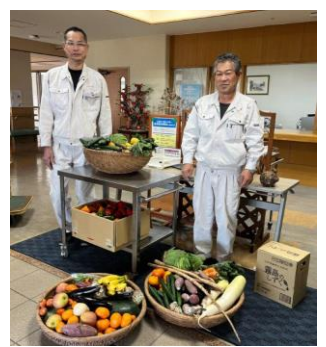
（新嘗祭）宮崎神宮様