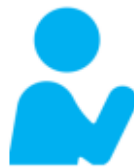
慢性肝臓病 がん 心血管疾患 など