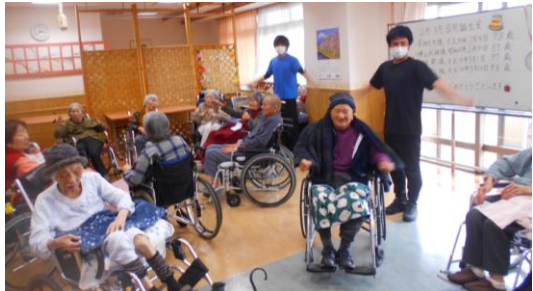
レクリエーション活動