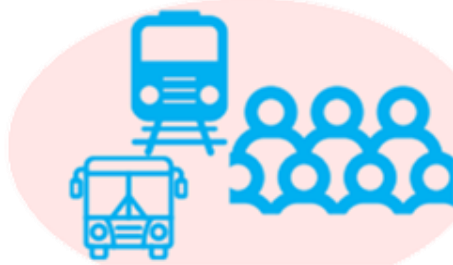
通勤ラッシュ時など混雑した 電車・バスに乗車する時