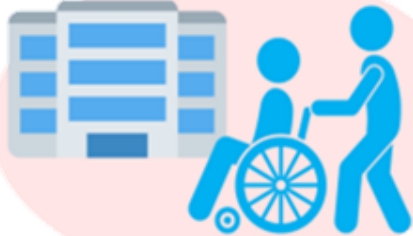
受診時や医療機関・ 高齢者施設などを訪問する時